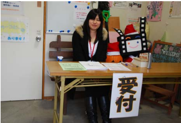
プレゼン講座受付中