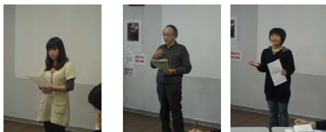
発表をする参加者